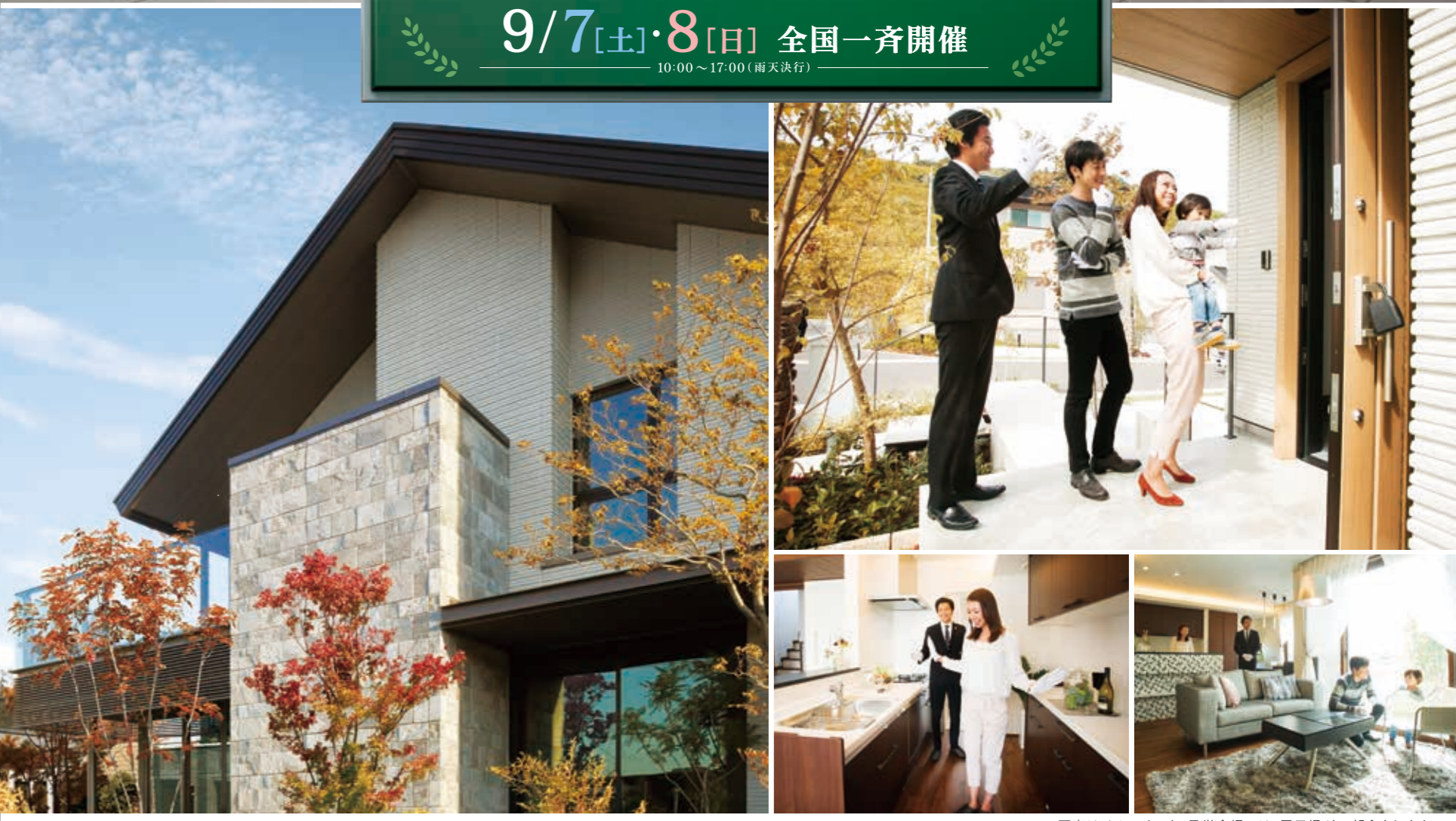
写真はイメージです。見学会場には、展示場が一部含まれます。